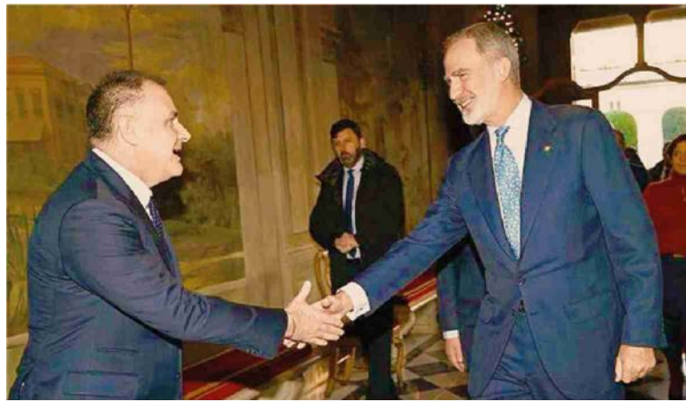
L'incontro. Il presidente di Confindustria Emanuele Orsini con il Re Filippo VI di Spagna