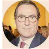
ANTONIO GARAMENDI Presidente di Ceoe (la Confindustria spagnola)