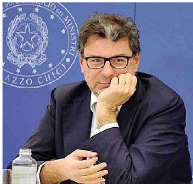
Giancarlo Giorgetti, ministro dell'Economia

Il concordato preventivo biennale è lo strumento, introdotto dal governo Meloni, che consente per due anni di pagare le tasse sulla base di una proposta formulata dall'Agenzia delle Entrate, coerente con le informazioni delle banche dati dell'amministrazione finanziaria e i redditi dichiarati