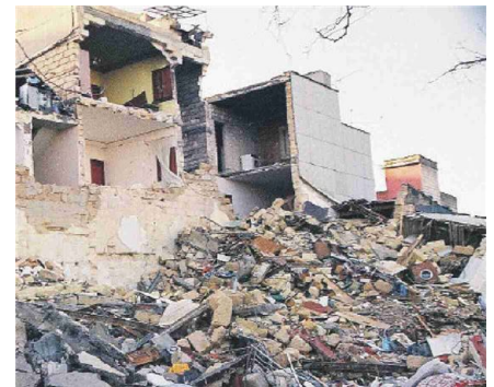
Una zona a rischio

Carlentini è stato uno dei pochi della provincia di Siracusa a beneficiare di oltre 18 milioni di euro finanziati con i fondi del Pnrr. Quasi tutti i lavori sono stati completati. Si tratta di progetti volti alla riduzione dei fenomeni di marginalizzazione e degrado sociale nonché al miglioramento della qualità del decoro urbano e del tessuto sociale ed ambientale che interessano Carlentini centro, zona nord e la frazione di Pedagaggi. Fra questi uno dei più importanti riguarda l'area del parco archeologico, il cui finanziamento ammonta a poco meno di 3 milioni di euro, finalizzato a consegnare alla città un'area fino ad ora abbandonata. In materia di rigenerazione urbana, il parco di largo Matteotti nella zona nord, è stato appena consegnato corredato da panchine, impianto di illuminazione, ringhiera in legno. A questo si aggiunge il parco intitolato a Emanuele Ferraro realizzato affinché diventi un luogo di aggregazione sociale. Tra le opere finanziate i cui lavori stanno per essere ultimati anche l'area di aggregazione e l'ex macello di piazza Malta che a breve sarà inaugurato. A Pedagaggi i lavori avviati interessano la riqualificazione urbana del parco adiacente piazza Madonnina del grappa.