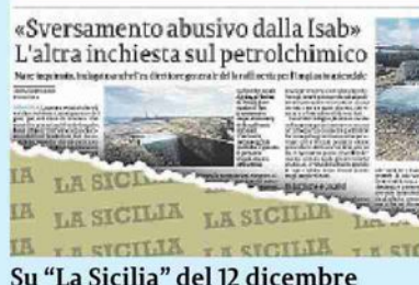
Su "La Sicilia" del 12 dicembre