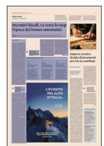
Peso: 1-4%, 11-34%

L'articolo 9 della bozza prevede che l'accesso agli incentivi venga precluso per le imprese che non rispetteranno l'obbligo di stipulare una polizza assicurativa per danni da eventi catastrofali, oggetto ancora nei giorni scorsi di un serrato dibattito tra governo e imprese sulla data dell'entrata in vigore.