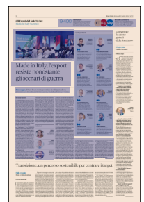
Peso: 1-3%, 24-59%

«È importante che le politiche industriali europee siano declinate sulle caratteristiche dei territori e dei settori produttivi»