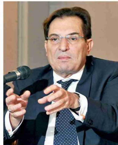
▲ L'ex governatore Rosario Crocetta è accusato nel processo bis di essere stato parte del sistema Montante