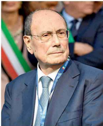
▲ Il presidente Renato Schifani è finito nel processo bis nell'ambito della catena delle talpe di Montante