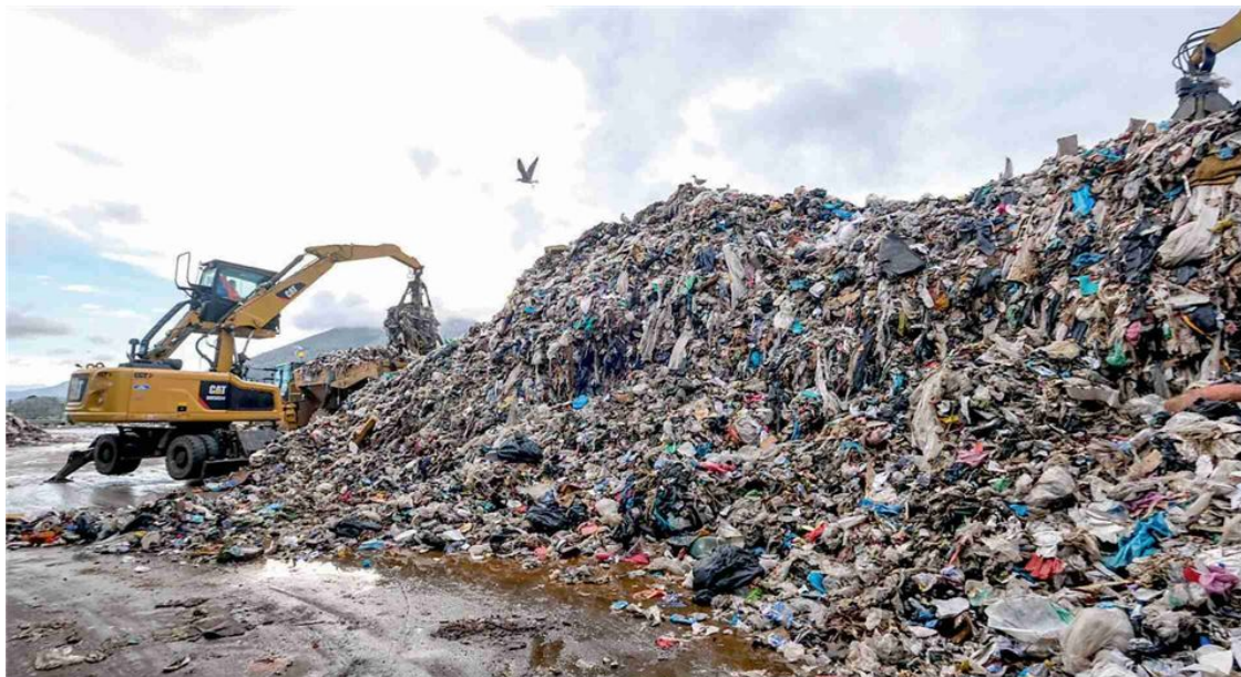
▲ La protesta Le associazioni ambientaliste preparano un nuovo ricorso contro il piano rifiuti

La norma approvata in Senato accelera l'iter per gli impianti da 800 milioni. L'Anci: «Pronti fra 4 anni, e intanto la Tari cresce»