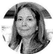
ROULA KHALAF Direttrice Financial Times