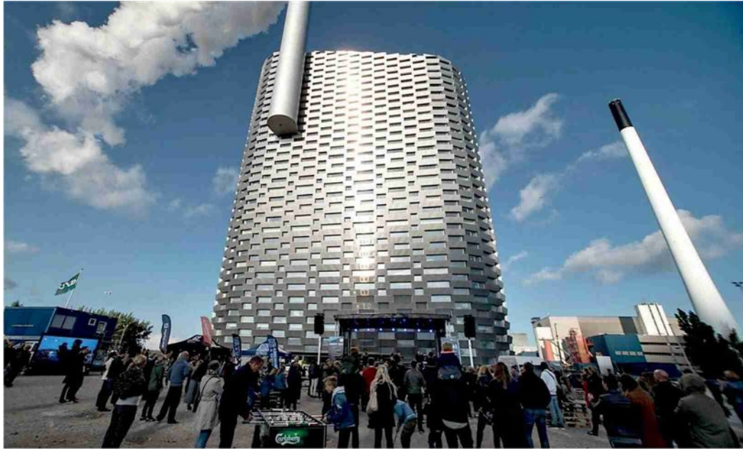
▲ L'impianto Il termovalorizzatore di Copenaghen: in Sicilia si progetta di farne due