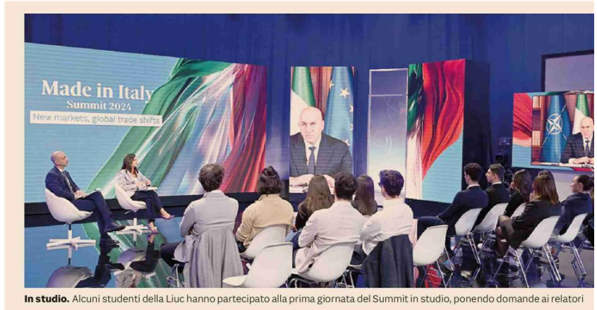
In studio. Alcuni studenti della Liuc hanno partecipato alla prima giornata del Summit in studio, ponendo domande ai relatori

«Sulla decarbonizzazione l'Europa ha obiettivi ambiziosi ma onerosi. Con l'innovazione, il processo risulta più fattibile ed economicamente sostenibile»