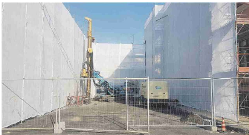
Prende nuova vita lo spazio di via Cannizzaro (accanto al municipio)

gamento con Catania e una messa in servizio del collettore, non si è risposto e si è lasciato intendere, o così ha capito chi ha posto la domanda, che altri tre anni non bastano. A questo punto ci chiediamo, quanto dobbiamo aspettare ancora per essere allacciati a Catania, chi deve «spingere» per far sì che si realizzino subito, o quanto meno con un timing dei lavori che si avvicini il più possibile alla fine di quelli previsti ad Aci Castello, la gara di progettazione sia del vecchio allacciante che del nuovo sia il cambio di pendenza del sifone di piazza Galatea sia l'allargamento del vecchio tratto dell'allacciante all'incrocio tra via etnea e via San Giuliano? Non c'è il concreto rischio che finiti i lavori ad Aci Castello bisogna aspettare che si progettino, appaltino e realizzino queste ulteriori opere a Catania per poter finalmente far funzionare il collettore?».