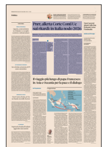
Peso: 1-2%, 7-19%

cialmente solo 52,2 miliardi, cioè il 51% dei fondi già incassati. Il Governo nell'ultima relazione semestrale sull'attuazione del Pnrr ha voluto sottolineare l'avanzamento del processo di «attivazione» dei fondi, con quel 91% di risorse messo a gara che rappresenta la premessa essenziale per far finalmente decollare la spesa effettiva. Ma i ritmi richiesti per raggiungere il traguardo di metà 2026 con il piano completato sono ormai più che ambiziosi, e imporrebbero di mantenere una spesa aggiuntiva da Pnrr nell'ordine dei 47 miliardi all'anno dopo averne realizzati 52,2 in tre anni e mezzo, e di concentrare nel 2026 il 62% degli investimenti secon-