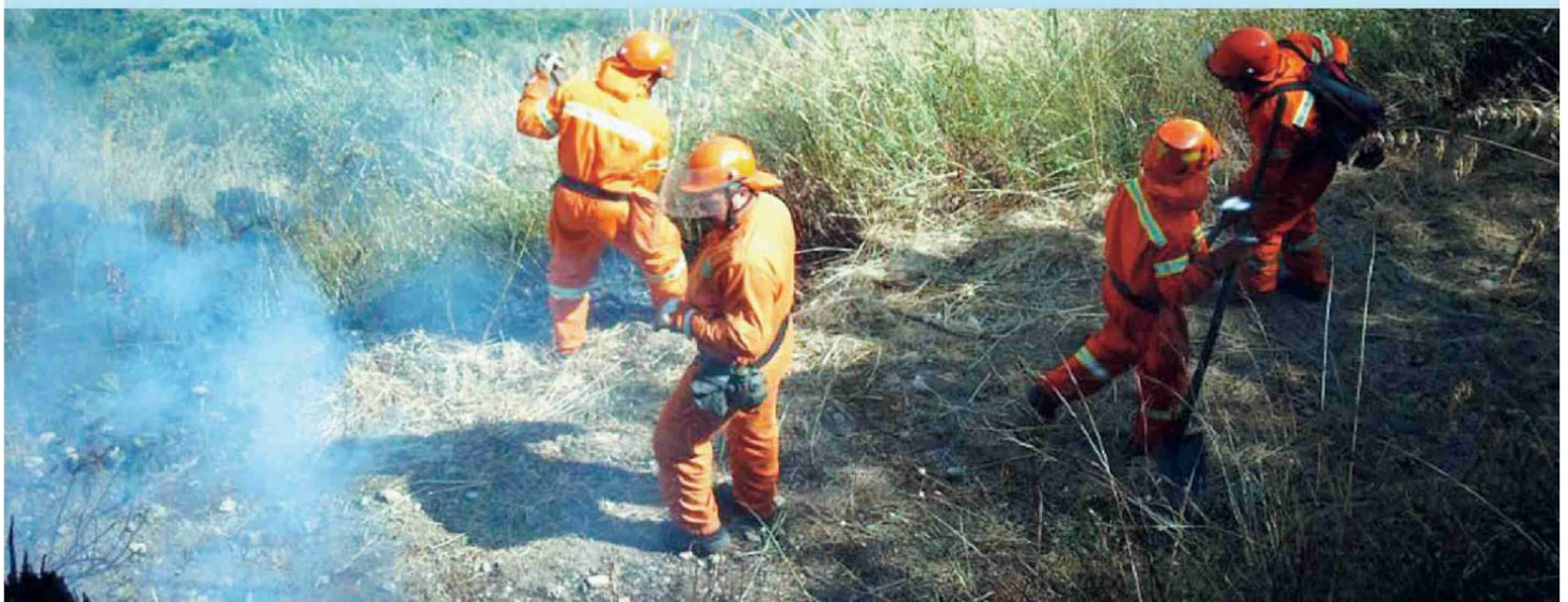
Lotta agli incendi. L'organico dei forestali va rinforzato. Ma un primo concorso da 46 posti è stato bloccato per anomalie nella graduatoria dopo la prova a quiz