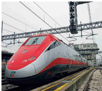
Privatizzazioni Obiettivo 3 miliardi in manovra, nel mirino anche le Ferrovie dello Stato

Appare invece in salita il dossier pensioni con la Lega spinge per Quota 41, ma FI: «Alzare le minime»