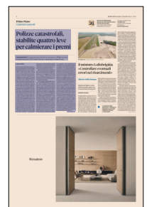
Peso: 1-4%, 4-19%

Il lavoro di affinamento del decreto si è concentrato su alcuni aspetti finalizzati anche a ridurre il peso dell'esposizione per le compagnie e il premio