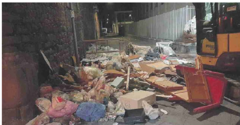
Rimozione di rifiuti in via Mulini a vento

menti di tutti i giorni. Differenziata compresa». Che proprio qui ha raggiunto livelli storici minimi, con la ormai storica discarica di via Toledo e nella ex scuola Brancati, dove tuttavia è prevista la realizzazione di uno dei "Catania Spazio Sport" sulla scorta dei tanti realizzati in città. Il "sogno urbano" si inizia anche da qui. ●