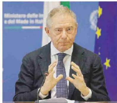
Il ministro Adolfo Urso

La misura, attivata nell'ambito del Fondo per la crescita sostenibile, è destinata al sostegno dei progetti di imprese ammesse ai finanziamenti agevolati del Fri (Fondo rotativo per il sostegno alle imprese e gli investimenti in ricerca), accompagnati da contributi diretti alla spesa a sostegno delle attività. Le attività di ricerca industriale e sviluppo sperimentale devono essere finalizzate alla realizzazione di nuovi prodotti, processi o servizi o al notevole miglioramento di prodotti, processi o servizi esistenti. Finanziamenti agevolati di Cassa depositi e prestiti a valere sulle risorse del Fri hanno una percentuale nominale delle spese e dei costi ammissibili pari al 50%. In caso di accesso da parte delle piccole e medie imprese alla maggiorazione del contributo alla spesa del 10%, il finanziamento agevolato è concedibile in misura pari al 40% delle spese e dei costi ammissibili. ●