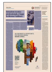
Peso: 1-3%, 4-32%

ai nostri ragazzi, secondo programmi fortemente innovativi, che assicureranno competenze teoriche e pratiche di qualità, anche grazie al contributo delle imprese. È un giornata importante per il futuro dei ragazzi e del nostro sistema produttivo. Il maggior collegamento tra formazione e impresa - ha proseguito il titolare del Mim - è stato tra l'altro condiviso al recente G7 Istruzione di Trieste, riscuotendo un consenso unanime. E la risposta che è già arrivata dal Sud, con