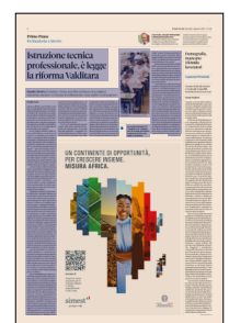
Peso: 1-3%, 4-32%