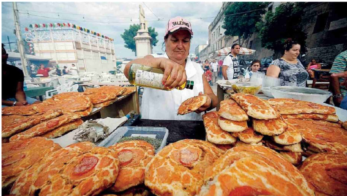
Finanziaria. Pioggia di soldi per sagre e anche per lo «Sfincione Fest» durante la manovra estiva

che ricorda le «risorse per la crisi idrica e l'agricoltura, il sostegno ai Comuni in difficoltà, gli interventi per i Consorzi di bonifica e gli aiuti alle imprese femminili, giovanili e alle start up. Abbiamo stanziato nuove somme anche per la promozione turistica in modo da favorire la destagionalizzazione dell'offerta e rendere più strutturata la crescita degli arrivi che segna già un record grazie alle politiche del governo. Con la manovra approvata ieri dall'Ars abbiamo dato risposta ad alcune delle più pressanti emergenze, guardando anche allo sviluppo economico dell'Isola». (*ADO*)