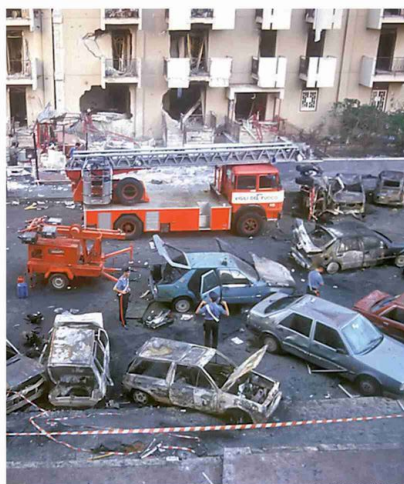
L'attentato a Paolo Borsellino, il 19 luglio del 1992

I documenti collegavano famiglie malavitose al Gruppo Ferruzzi Gardini