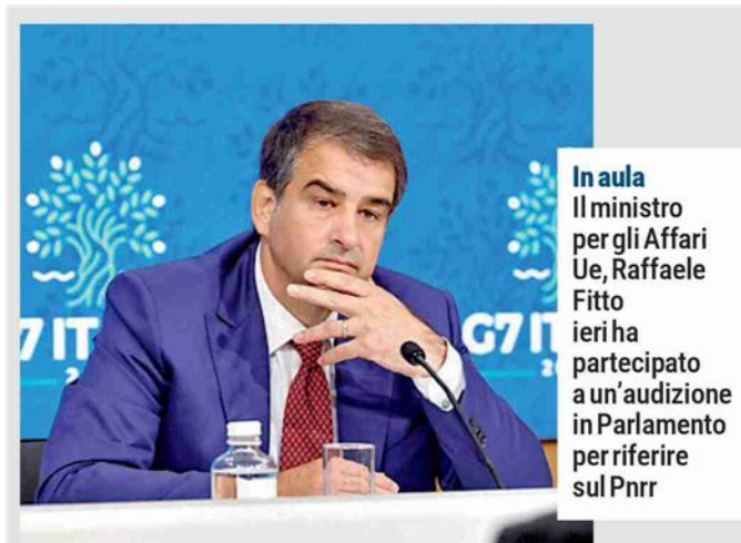
In aula Il ministro per gli Affari Ue, Raffaele Fitto ieri ha partecipato a un'audizione in Parlamento per riferire sul Pnrr

Oltre ad aspettarsi a breve di incassare la quinta rata sempre ieri Fitto ha confermato che anche i 37 obiettivi programmati per la sesta rata sono stati raggiunti nei termini previsti cosa che ha consentito al governo di poter inviare entro il termine di giugno la richiesta di pagamento. Adesso di lavoro sulla settimana, scadenza a fine anno e altri 18,2 miliardi da incassare. —