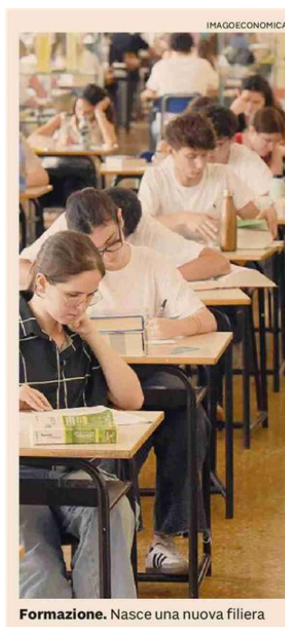
Formazione. Nasce una nuova filiera

La novità principale è il "modello 4+2", quattro anni di scuola secondaria superiore più due anni negli Its Academy