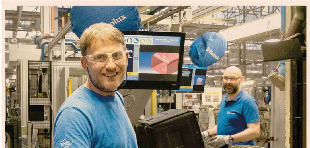
I ventilatori. Nel sito Electrolux di Forlì sono stati installati 530 ventilatori sulle singole postazioni

Dalla collaborazione tra Cnr, Inail e diversi istituti sanitari di eccellenza è nato un decalogo che suggerisce alle imprese, tra l'altro, di designare una persona che sovrintenda al piano di sorveglianza per la prevenzione dello stress da caldo, di identificare i pericoli e valutare i rischi, la sorveglianza sanitaria, la formazione, strategie individuali di prevenzione e protezione per i lavoratori come bere acqua secondo intervalli temporali non troppo ravvicinati e non in eccessive quantità e reintegrare i sali minerali, riorganizzare i turni di lavoro e prevedere l'alternanza dei lavoratori su quelli più a rischio stress da caldo, favorire l'acclimatazione dei lavoratori, promuovere il reciproco controllo dei lavoratori e avere un piano di risposta alle emergenze.