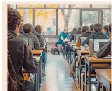
Istruzione. Scuola professionalizzante