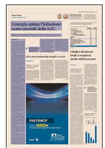
Peso: 1-1%, 2-22%

Unione Nazionale Consumatori stima una spesa aggiuntiva di oltre