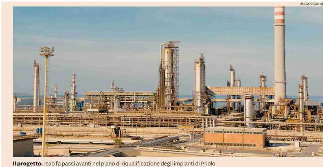
Il progetto. Isab fa passi avanti nel piano di riqualificazione degli impianti di Priolo

Per gli impianti di Priolo l'azienda ha varato un piano strategico che prevede investimenti per 750 milioni