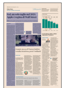
Peso: 1-4%, 5-33%

nellato quasi 30 massimi storici da gennaio, ha visto in giornata guadagni di circa l'1% e il tecnologico Nasdaq di quasi il 2 per cento. Apple, all'indomani del debutto di nuovi piani di artificial intelligence, ha riconquistato la corona di regina della market cap con un rialzo del 6%, oltre i 3.300 miliardi di dollari, sopravanzando Microsoft. La prospettiva di riduzioni dei tassi in arrivo, per quanto modeste, ha al contempo visto i rendimenti dei titoli decennali del Tesoro sci-