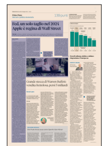
Peso: 1-4%, 5-33%