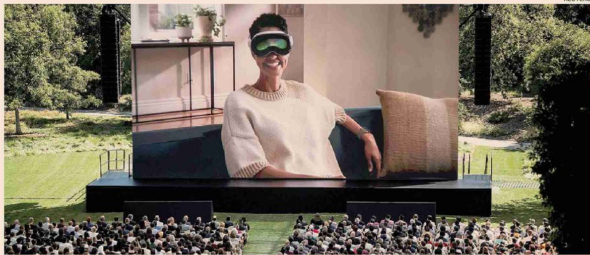
La svolta di Apple. La presentazione del nuovo progetto di intelligenza artificiale a Cupertino

Powell: «L'inflazione resta troppo alta» pur avendo "rallentato significativamente", l'outlook «incerto»