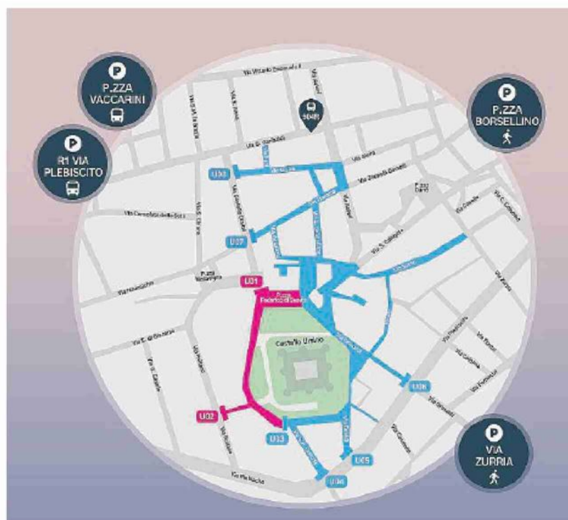
Sarà possibile raggiungere piazza Federico di Svevia a piedi o in navetta

Speriamo di non dover registrare un eccesso di mortalità delle attività in zona