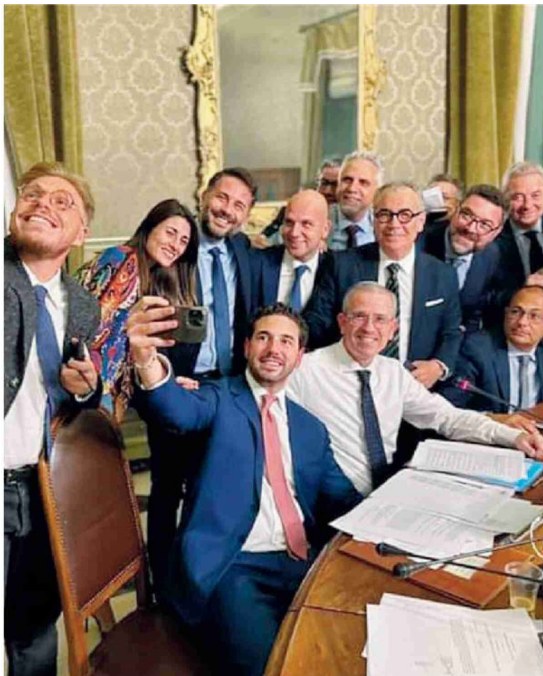
Ars. Il selfie tra maggioranza e opposizione che siglò l'intesa